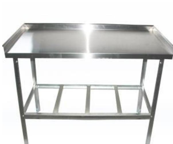
Рис.4 Стол производственный с бортом

Производственные столы, предназначенные для обработки пищевых продуктов, должны иметь покрытие, устойчивое к действию моющих и дезинфицирующих средств и отвечать требованиям безопасности для материалов, контактирующих с пищевыми продуктами.