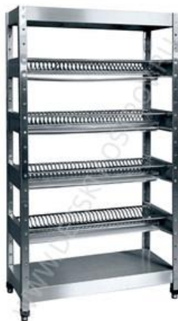
Рис.5 Стеллаж для сушки тарелок из нержавеющей стали

Для дозирования моющих и обеззараживающих средств используют мерные емкости. Просушивание чистой посуды осуществляют в опрокинутом виде на решетчатых полках и стеллажах.