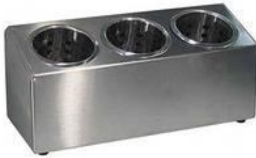
Рис. 7 Контейнер для столовых приборов из нержавеющей стали

Обработку кухонной посуды проводят согласно инструкции, утвержденной санитарными правилами (Приложение № 4):