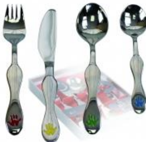
Рис.4 Столовые приборы

Столовые приборы (ложки, вилки, ножи) должны быть изготовлены из нержавеющей стали.