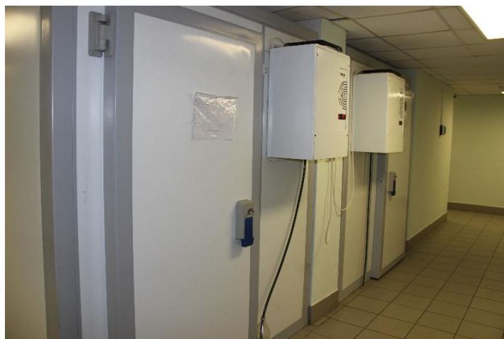
Рис. 1 Холодильное оборудование

При оснащении производственных помещений следует отдавать предпочтение современному холодильному и технологическому оборудованию (Рис.1).