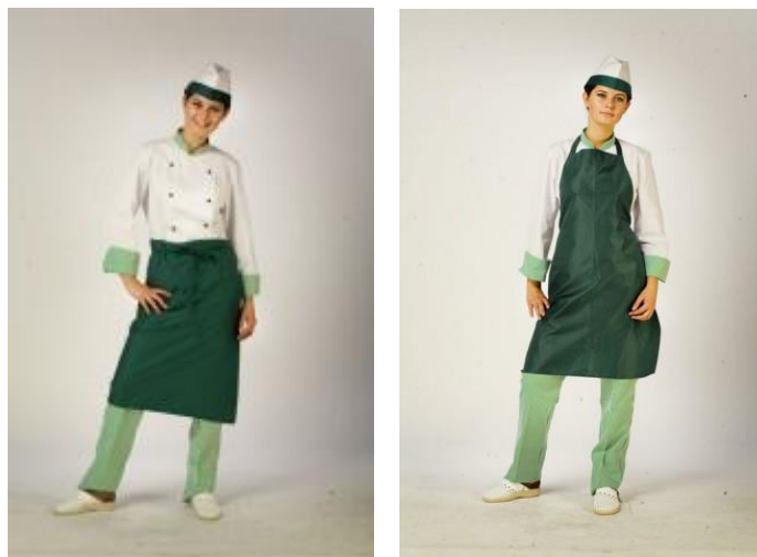
Рис.11 Санodeжда повара