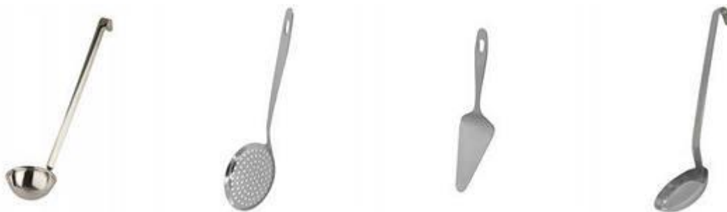
Рис. 7 Кухонный инвентарь

Для порционирования блюд используют инвентарь с мерной меткой объема в литрах и миллилитрах.