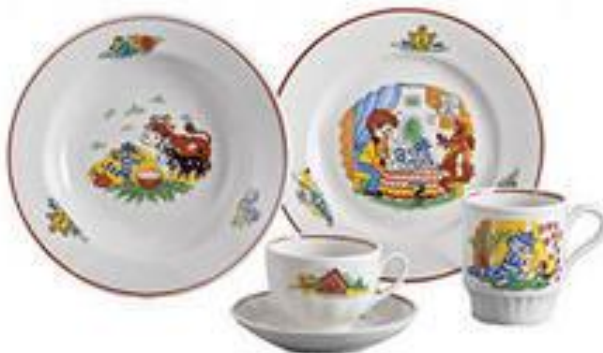
Рис 3. Столовая посуда

При организации питания используют фарфоровую, фаянсовую и стеклянную посуду (тарелки, блюда, чашки), отвечающей требованиям безопасности для материалов, контактирующих с пищевыми продуктами.