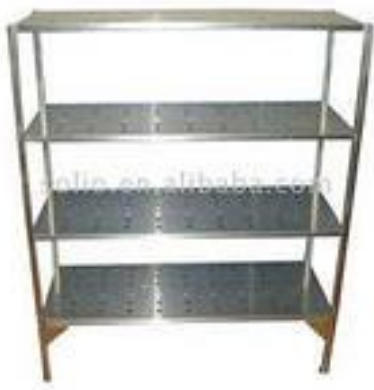
Рис.1 Стеллаж многоярусный

Стеллажи, подтоварники для хранения пищевых продуктов, посуды, инвентаря должны иметь высоту от пола не менее 15 см. Конструкция и размещение стеллажей и поддонов должны позволять проводить влажную уборку. На складах рекомендуется предусматривать многоярусные стеллажи.