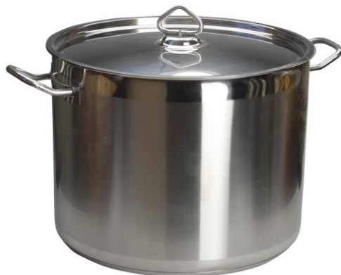
Рис.5 Котел из нержавеющей стали

Посуда для приготовления и хранения готовых блюд должны быть изготовлены из нержавеющей стали.