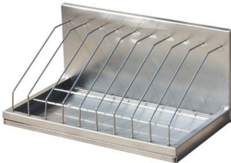
Рис. 10 Полка для хранения разделочных досок из нержавеющей стали

Мытье разделочных досок и мелкого деревянного инвентаря производится в моечном отделении (цехе) для кухонной посуды горячей водой при температуре не ниже 45°C с добавлением моющих средств, ополаскивают горячей водой при температуре не ниже 65°C и ошпаривают кипятком, а затем просушивают на стеллажах на ребре. После обработки и просушивания разделочные доски хранят непосредственно на рабочих местах на ребре.