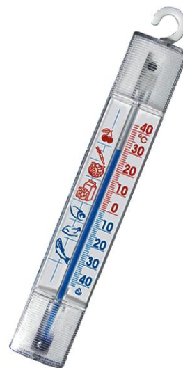
Рис.9 Термометр для холодильника